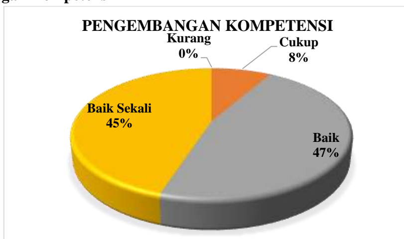
Diagram 3.1 Presentase Hasil Survei Kepuasan Tenaga Kependidikan terhadap Pengelolaan SDM Manajemen pada Aspek Pengembangan Kompetensi

Berdasarkan Diagram 3.1 di atas dapat dilihat bahwa Tenaga Kependidikan yang memberikan nilai Baik Sekali 45% dan Baik sebanyak 47%. Nilai terbanyak terdapat pada poin 2: Mendapatkan arahan mengenai pekerjaan dari atasan unit kerja. Tenaga Kependidikan yang memberikan penilaian Cukup sejumlah 8% dan tidak ada yang memberikan penilaian kurang pada aspek ini. Sehingga pada aspek Pengembangan Kompetensi berada pada kategori Baik Sekali .