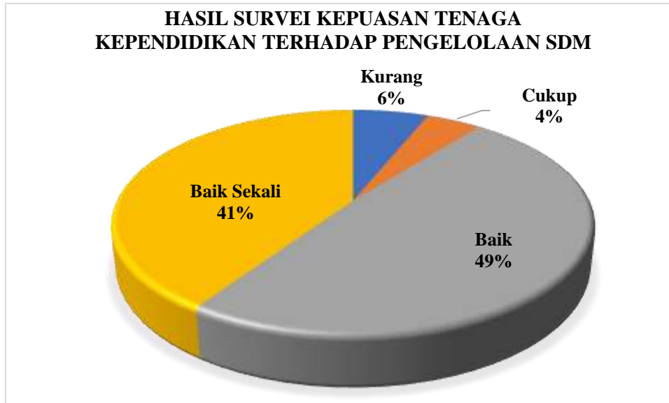
Diagram 4.1 Persentase Hasil Survei Kepuasan Tenaga Kependidikan terhadap Pengelolaan SDM Prodi Manajemen

Berdasarkan hasil survei dapat dilihat pada Diagram 4.1 yang menggambarkan bahwa secara keseluruhan Tenaga Kependidikan program studi Manajemen memberikan nilai Baik Sekali sejumlah 41%, nilai Baik sejumlah 49%, nilai Cukup sejumlah 4%, nilai kurang 6%. Jika merujuk pada Tabel 2.3 nilai persentase tersebut berada pada rentang 41-60%, sehingga dapat disimpulkan bahwa kepuasan Tenaga Kependidikan terhadap Pengelolaan SDM di program studi Manajemen masuk pada kategori CUKUP BAIK .